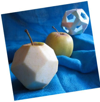
Segundo premio 2016-2017

OBJETIVO: Incentivar a ver las matemáticas como parte de nuestra vida y nuestro entorno.