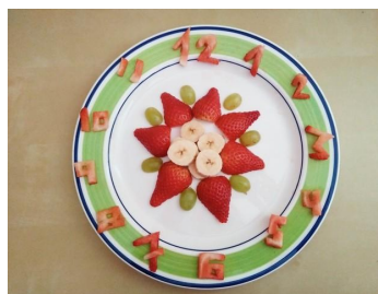
Tercer premio 2016-2017

AUTORÍA DE LAS IMÁGENES. Las fotografías deben ser originales y en ningún caso se aceptarán fotos descargadas de Internet, ni escaneadas de ningún tipo de medio gráfico. No se acepta tampoco, ningún tipo de retoque fotográfico que cambie el contenido de la misma.